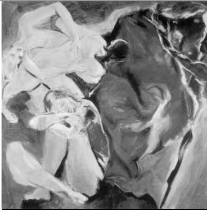
JL Guermann - Euphonia toile 180 x 180 cm acrylique et pigments

Et le 15 décembre, on fêtera Sainte Lucie, la Patronne des verriers, en compagnie des artistes... Du 17 novembre au 31 décembre Contact et informations : Bernadette Colibert 34270 Claret Tel : 04 67 02 84 44