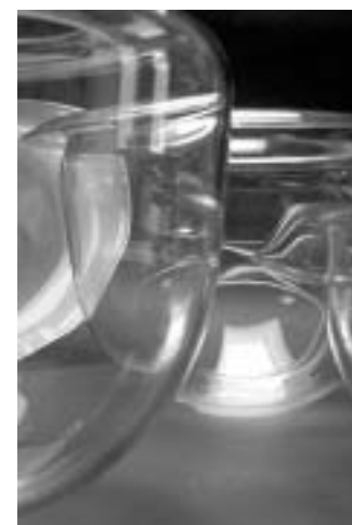
Pièces Jérémy Cadet - apprenti verrier à la main

La négociation financière est pratiquement terminée, la Région étant disposée à reconnaître les spécificités du CERFAV lesquelles impliquent des dédoublements de groupes (dispensés/non dispensés en enseignements généraux ; verriers à la main d'entreprises/verriers d'ateliers).